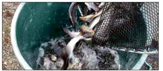
2 000 smolt (Gullspångsöringar) sattes ut i söndags nedanför kraftstationen i Upperud.